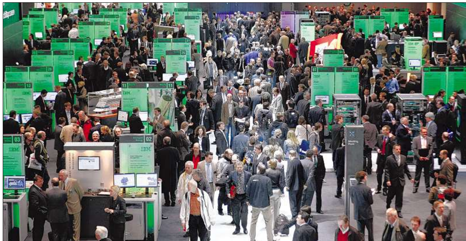
GROSSER ANDRANG herrscht auf dem CeBIT-Messestand des Software-Riesen IBM in Hannover. Im Fokus der Weltleitmesse der Informationstechnologie standen gestern aber auch zwei kleine aufstrebende Karlsruher Internet-Unternehmen, die einen Multimedia-Preis entgegennahmen.